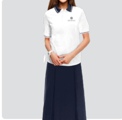
Girls Grade 6 - Grade 12