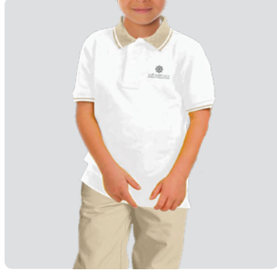
Boys KG 1 - KG 2

يسهم الزي المدرسي في توفير بيئة تعليمية تسودها المساواة بين الطلاب كما أن الالتزام به يدل على الانتماء للجهة والفئة التي ينتهي اليها الطالب، وتعود ابناءنا وبناتنا على الأنظمة والقوانين