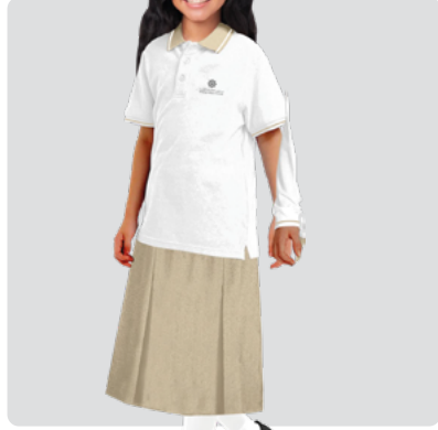
Girls Grade 1 - Grade 5