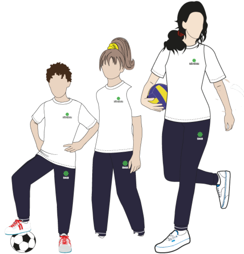
Boys KG - Grade 2