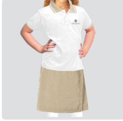
Girls KG 1 - KG 2